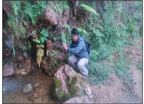
Pequeña laguna en la parte baja del cerro desde donde se relata leyendas.