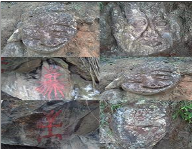
Huacas Misteriosas a la falda del cerro desde donde del cual se narran muchas leyendas y mitos.