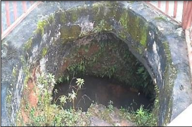
Túnel en la cima del cerro del cuál se desprenden varios mitos y Leyendas.