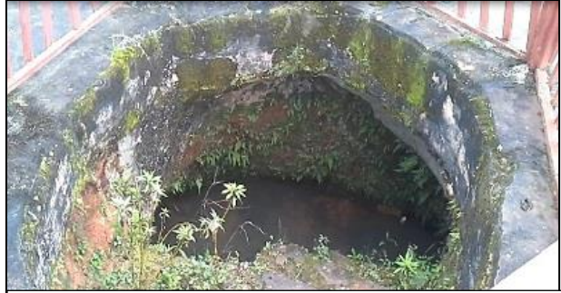
Fig. 8: Cráter de origen volcánico en la cima del cerro

Aunque los relatos contados por Armil y corroborados por otros moradores de los alrededores del cerro no tienen una estructura específica, he tratado de organizarlos en mitos y leyendas, teniendo en cuenta las características que hacen diferentes un tipo de otro, en el caso de los mitos considero que el tipo de mito que se narran a continuación son del tipo mitos morales: