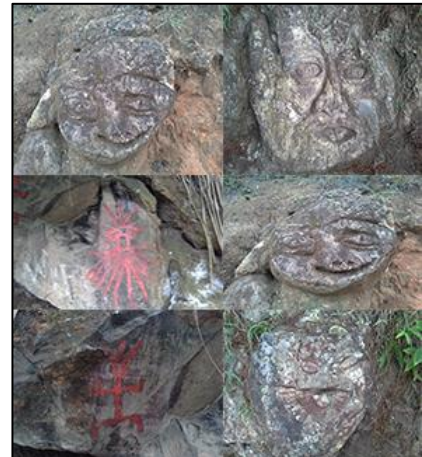
Fig. 10: Huacas Misteriosas

A medida que nos retiramos del cerro, este comienza a despejarse, permitiéndonos ver a los lejos su esplendor y su imponencia ante los demás cerros que lo rodean; y como que en son burlón, nos dice que es mejor visitarlo y escuchar los relatos in situ, que difundirlo de la manera que pienso hacerlo, pues siempre estará abierto para quienes lo visiten con el interés de disfrutarlo como un “mirador natural turístico”.