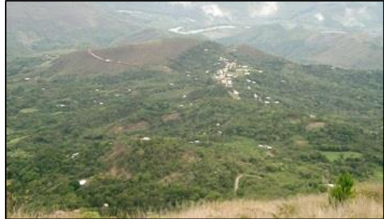
Fig. 3: Vista paisajística desde el Campana

Este termino era una palabra que había creado con la unión de dos voces inglesas: folk (pueblo) y lore (saber) para referirse a todas las manifestaciones ancestrales de las cultura del mundo que sobreviven hasta la actualidad; es decir a la sabiduría, artes, música y costumbres del pueblo transmitida de padres a hijos desde tiempos inmemoriales, la cual nos permite identificarnos como una nación.