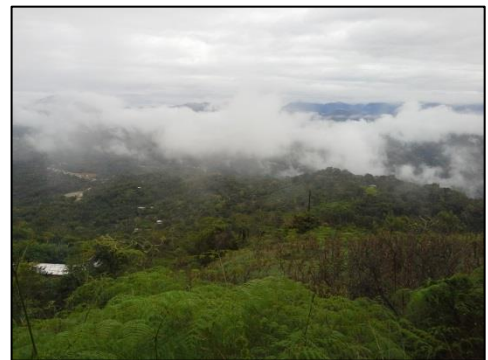
Fig. 5: Fauna y Flora que rodea al cerro

Habiendo recorrido un trayecto de 30 minutos en motocicleta, desde la ciudad San Ignacio hacia el cerro Campana nos adentramos, poco a poco en la diversidad de la fauna y flora que rodea al cerro (fig. 5), por un sendero de tierra firme y lodo, bordeado por hermosos pinos que se elevan imponentes hacia un cielo gris. El día de la visita al cerro no tuvimos la suerte de encontrar un clima propicio para poder disfrutar en su esplendor los paisajes maravillosos que se observan desde la cima, y como dirían los mismos pobladores, “el cerro no se quiso abrir para nosotros”, ya que una densa neblina cubría y ocultaba los paisajes naturales.