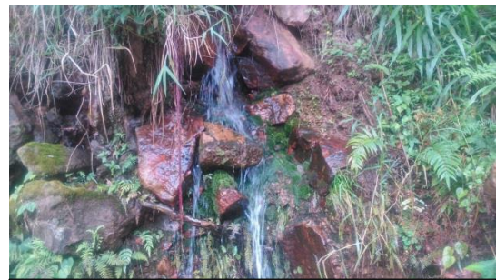
Fig. 4: Manantial de agua

Por otro lado las leyendas y mitos presentan sus propia definiciones y características. El diccionario de la Real Academia Española (2001, 22. a ) define a Mito como “Narración maravillosa situada fuera del tiempo histórico y protagonizada por personajes de carácter divino o heroico. Con frecuencia interpreta el origen del mundo o grandes acontecimientos de la humanidad”; y Leyenda como “Relación de sucesos que tienen más de tradicionales o maravillosos que de históricos o verdaderos”