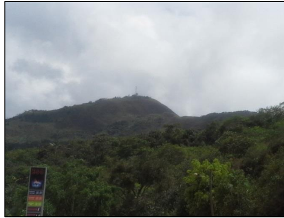
Fig. 1: Al fondo el Cerro Campana

Los mitos y leyendas que rodean a este cerro hace más interesante y atractivo su visita; un campo de acción donde aplicar investigación etnográfica, por lo tanto la pregunta que se constituye como un faro orientador de la presente investigación es la de ¿Qué mitos, leyendas y tradiciones hacen de este hermoso mirador natural un atractivo turístico, como un referente importante de identidad cultural?